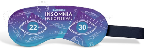
Eventos, Teatro, Televisión, Deporte, Música, ...