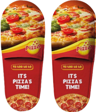
Comida a domicilio