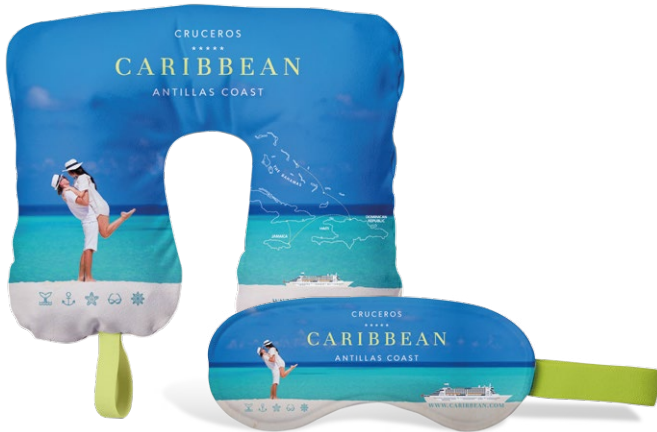
Cruceros, Viajes de incentivos, ...