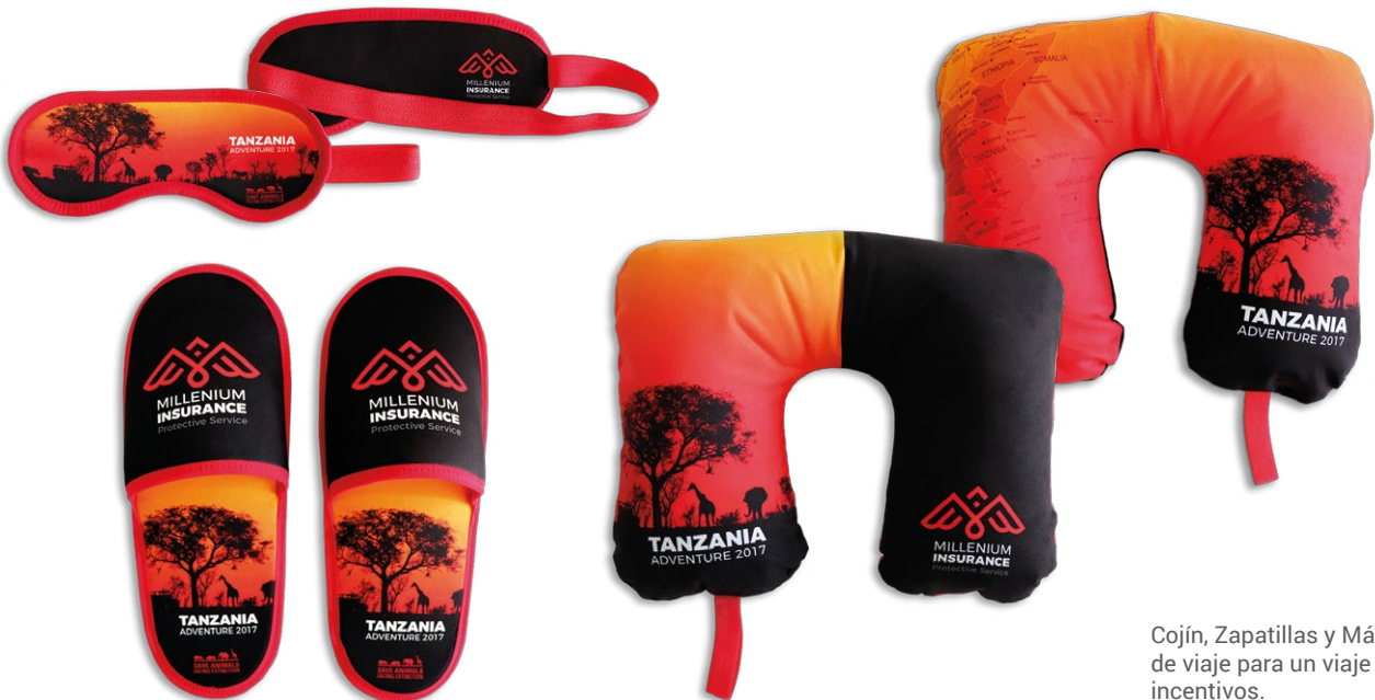
Cojín, Zapatillas y Máscara de viaje para un viaje de incentivos.