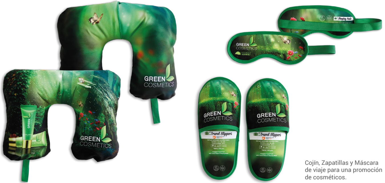
Cojín, Zapatillas y Máscara de viaje para una promoción de cosméticos.