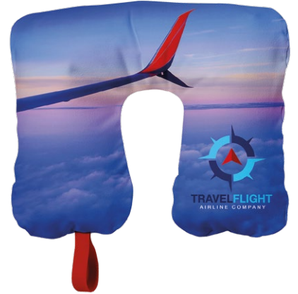
Compañías aéreas, Trenes, ...