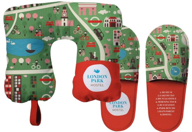
Hoteles, Spas, ...