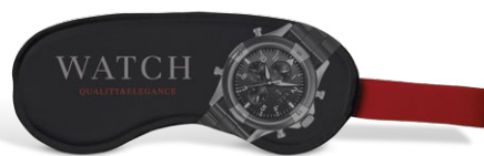
Relojes, Accesorios Premium, Joyas, Coches, Moda, ...

¡Tus clientes llevarán su marca por todo el mundo!